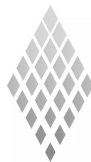
Renault éparpillé façon puzzle

L'enthousiasme affiché a bien du mal à ruisseler du sommet de la hiérarchie aux UET et aux salariés du bas. L'inquiétude des équipes est déjà palpable, la complexité induite apparaît au grand jour, l'efficacité collective en est déjà affectée.